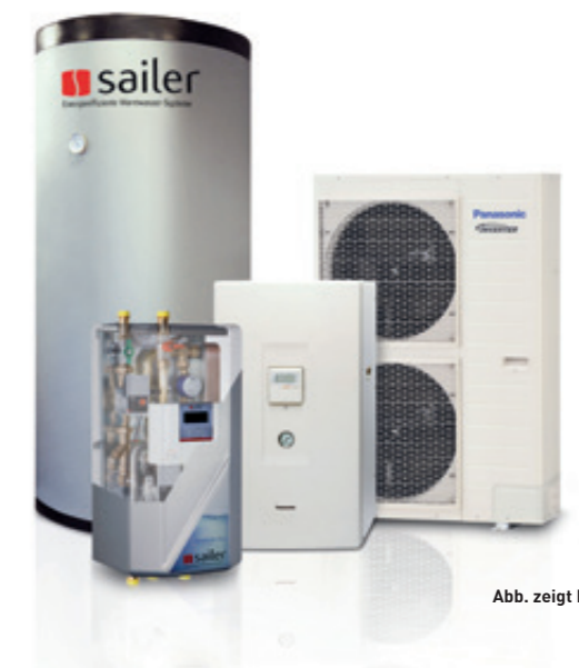
Abb. zeigt Beispiel

Die hocheffiziente Luft-Wasser-Wärmepumpe nutzt die erneuerbare Energie aus der Umgebungsluft zum Heizen und zur Warmwassererzeugung. Das Kombigerät in Splitbauweise besteht aus einer leistungsstarken Außeneinheit mit modulierendem Inverter-Plus-Verdichter und Designhaube, sowie einer platzsparenden Inneneinheit mit integriertem 200Liter Edelstahl-Warmwasserspeicher. Mehr als 200 Mio. verkaufte Verdichter unterstreichen die herausragende Qualität und Zuverlässigkeit der Wärmepumpen.